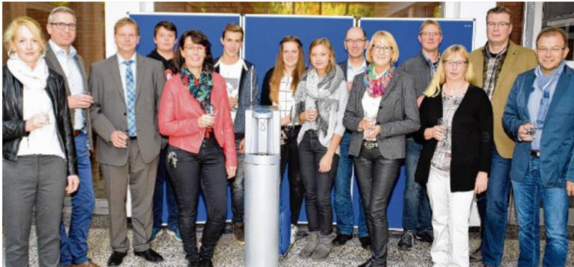
Gemeinsam stellten die Vertreter der Schüler, die Schulleiter, die Förderer und die Bildungsinitiative in der Liudger-Realschule in Emsbüren das Projekt „Trinkwasserspender“ vor.

Ab sofort haben alle Schülerinnen und Schüler der Emsbürener Schulen die Möglichkeit, sich während der Schulzeit kostenlos mit Wasser und Mineralwasser zu versorgen. Die Bildungsinitiative bedankte sich vor allem bei den Sponsoren der H&R ChemPharm, dem Wasserverband Lingener Land und der Firma Lonnemann Optik´s für die Unterstützung an diesem Projekt.