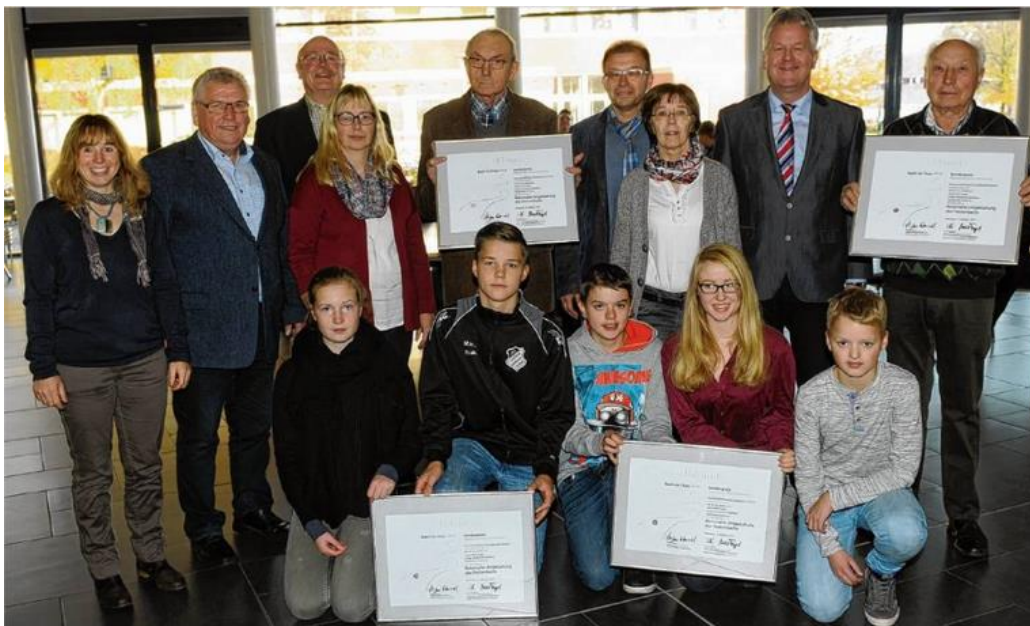
Danke für die Renaturierung des Fleckenbachs sagte jetzt die Naturschutzstiftung des Landkreises Emsland.

Kurze Zeit später bedankte sich die Naturschutzstiftung des Landkreises Emsland bei den teilnehmenden Schulen (Liudger-Realschule, Hauptschule Emsbüren) mit Urkunden und insgesamt 1000€ Preisgeld.