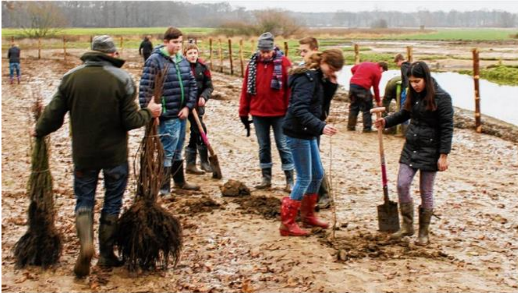
Ausgezeichnetes Engagement: Mehr als 120 Emsbürener Schüler pflanzten im Dezember 2015 am Ufer des Fleckenbaches rund 3000 heimische Bäume und Sträucher.

Die Niedersächsische Bingo-Umweltstiftung verlieh in diesem Jahr erstmalig einen Sonderpreis. Dieser ging an die Naturschutzstiftung des Landkreises Emsland für die „Naturnahe Umgestaltung des Fleckenbachs“. Begründet wurde die Vergabe mit der intensiven Einbindung